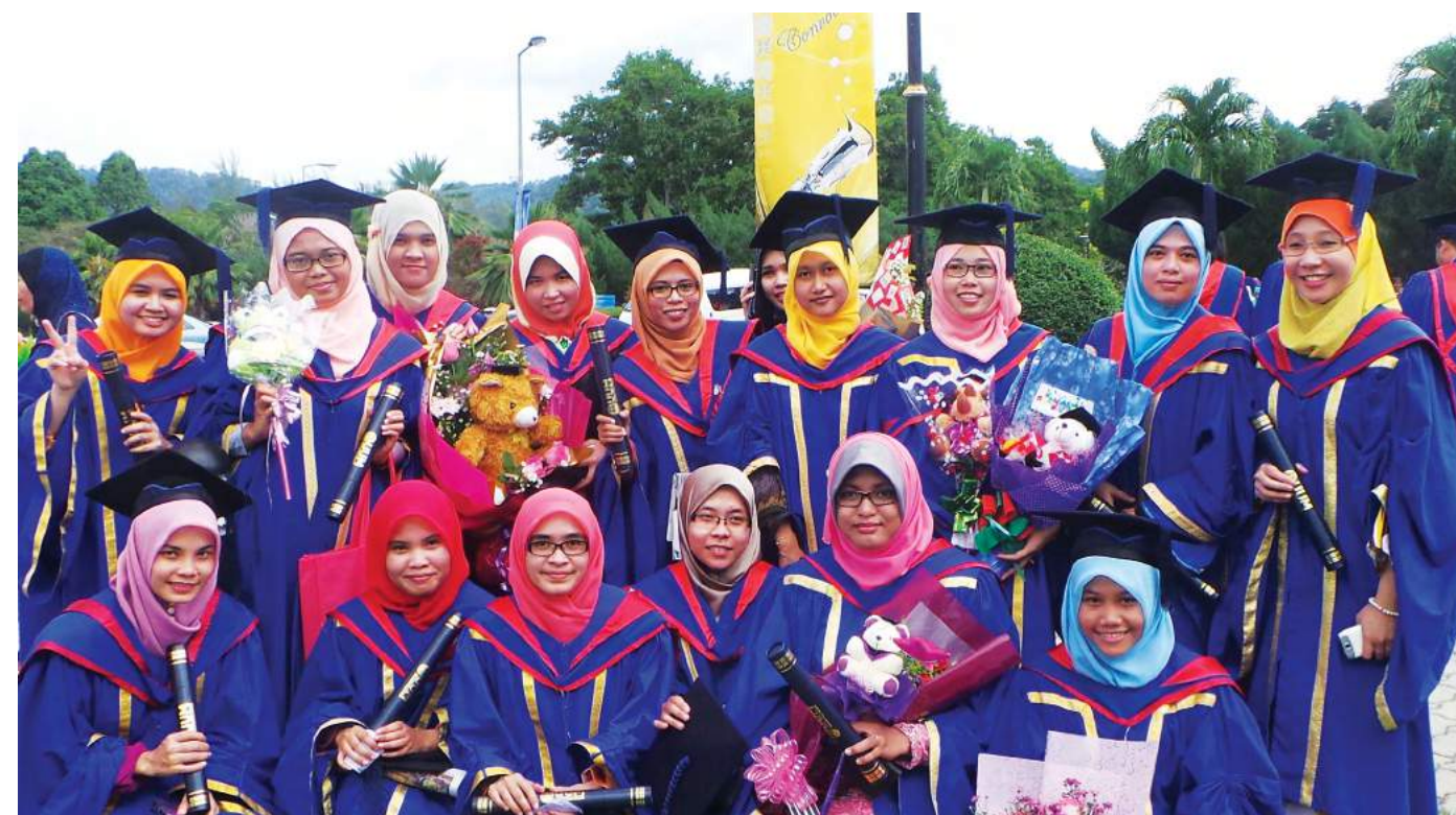
Tahniah diucapkan kepada semua graduan

Beliau berharap agar lebih ramai pelajar akan memilih program seumpama ini yang membuka peluang kepada generasi muda untuk membina kerjaya bukan sahaja di sektor kerajaan dan di sektor swasta tetapi sektor koperasi yang berpotensi untuk dikembangkan.