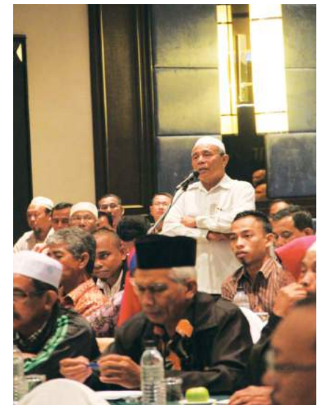
Sesi soal jawab bersama peserta

merupakan sektor bernilai tinggi yang mampu memberi pulangan yang lumayan jika diusahakan dengan cara yang betul. Kemahiran serta ilmu pengetahuan berkaitan penternakan perlulah dituntut supaya aktiviti atau perniagaan yang ingin dijalankan berjaya mendatangkan hasil. Manakala MKM sebagai institusi latihan dan pendidikan koperasi akan terus peka dalam menganjurkan program-program yang sesuai dengan persekitaran bagi membantu gerakan koperasi dengan ilmu-ilmu yang berguna supaya kelestarian gerakan koperasi dapat dikekalkan.