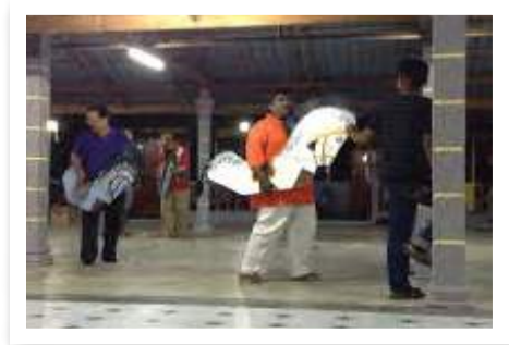
Aktiviti-aktiviti peserta kursus di Homestay Sg. Hj. Dorani (menangkap ikan, mencanting batik, menumbuk padi dan pertunjukan kebudayaan kuda kepang).