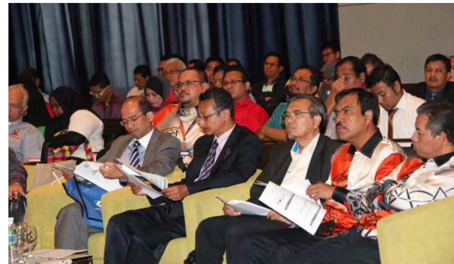
Ketua Pengarah MKM (dua dari kiri) bersama Pengarah Urusan PNS (kiri) dan tetamu yang hadir

Perbadanan Nasional Berhad (PNS). Program kerjasama MKM dengan PNS ini telah diadakan di Menara PNS, Bangsar South City Kuala Lumpur. Program ini telah berjaya menarik penyertaan koperasi dari sekitar Lembah Klang, Pahang, Kelantan, Terengganu, Negeri Sembilan, Melaka dan Johor. Seramai 225 orang koperasi telah menyertai Forum Profesional ini yang kebanyakannya terdiri daripada Anggota Lembaga Koperasi (ALK), pengurus, jawatankuasa kecil projek, pegawai-pegawai agensi kerajaan yang