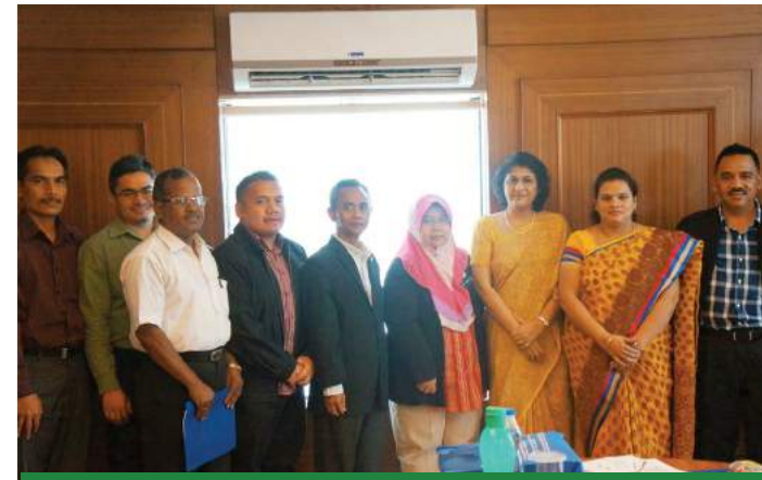
■ Lawatan ke Jijamata Women's Cooperative Bank, Pune