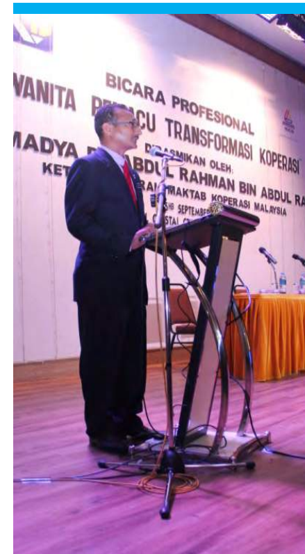
Ketua Pengarah MKM merasmikan majlis

oleh : Nur Shuhada Mohd Ali Pusat Tadbir Urus dan Perundangan Koperasi