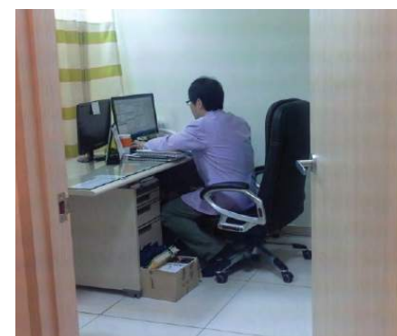
Bilik salah seorang doktor