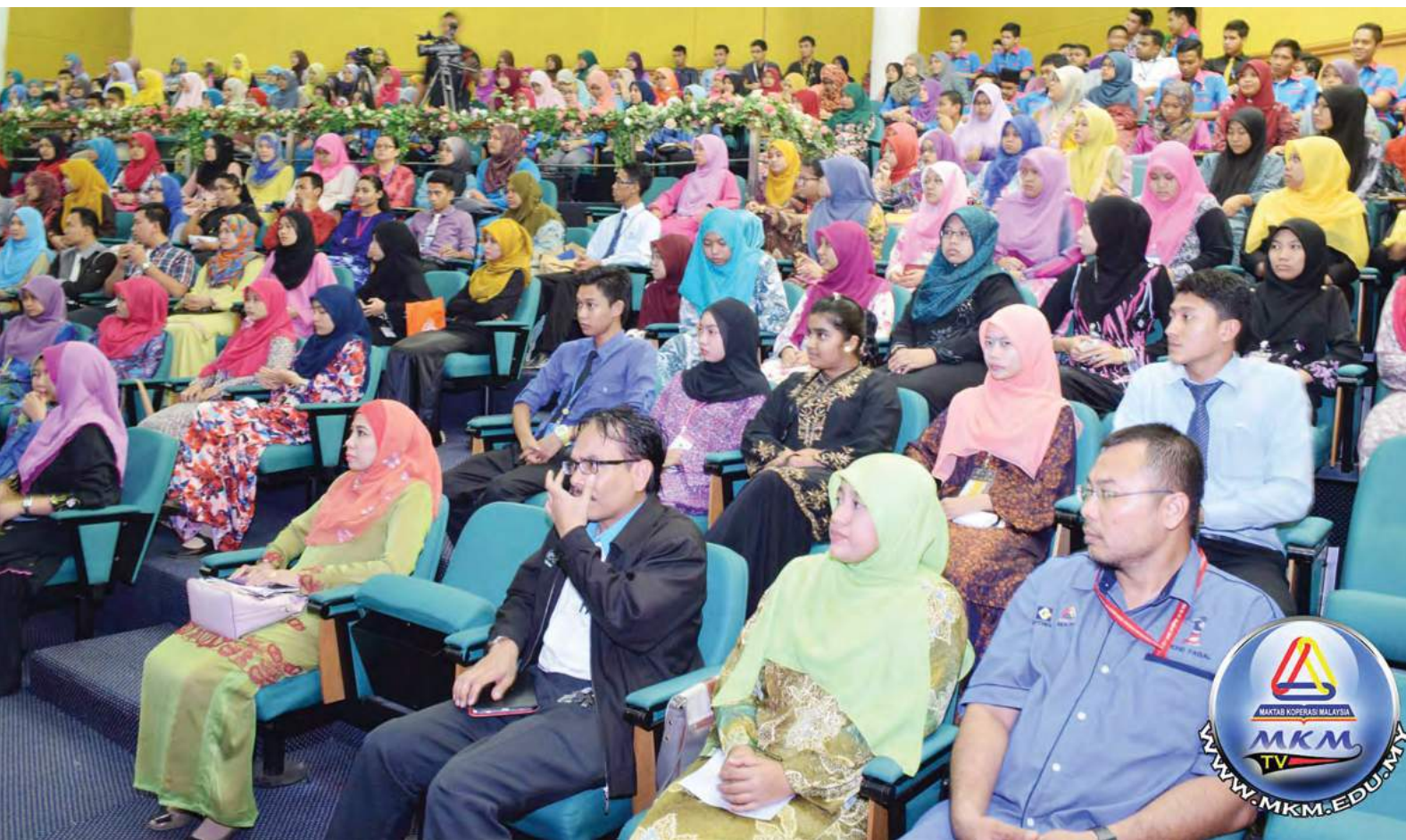
Turut hadir Pegawai Latihan MKM (Barisan hadapan)

di luar kampus. Semasa berada di kem Lembah Pangsun, para pelajar dibahagikan kepada beberapa kumpulan bagi memudahkan aktiviti-aktiviti seperti Latihan Dalam Kumpulan (LDK) diadakan. Pelbagai aktiviti telah dilakukan oleh pelajar seperti aktiviti 'Jual Beli', 'semangat bekerjasama', 'Check List Solat' dan sebagainya. Aktiviti-aktiviti ini bertujuan untuk memupuk semangat kerjasama sesama pelajar dan dapat mendedahkan pelajar