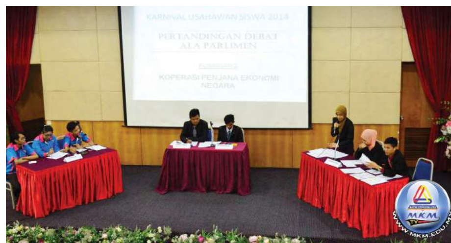
Pertandingan Debat Ala Parlimen yang dimenangi oleh pelajar DPK Semester 5

Secara keseluruhannya, Karnival Usahawan Siswa ini diharapkan dapat memupuk semangat berkoperasi antara pelajar serta menanamkan sikap keusahawan dalam diri mereka. Ia juga harap dapat dipraktikkan apabila melangkah ke alam pekerjaan kelak. Selain itu, karnival ini dapat memberikan impak yang positif kepada semua pihak seperti mengeratkan silaturrahim antara pelajar, pensyarah dan warga kerja MKM. Semoga ilmu asas keusahawanan akan dijadikan ilmu berpanjangan kepada pelajar dan meningkatkan kesedaran betapa pentingnya keusahawanan agar dapat meningkatkan taraf ekonomi di masa hadapan.