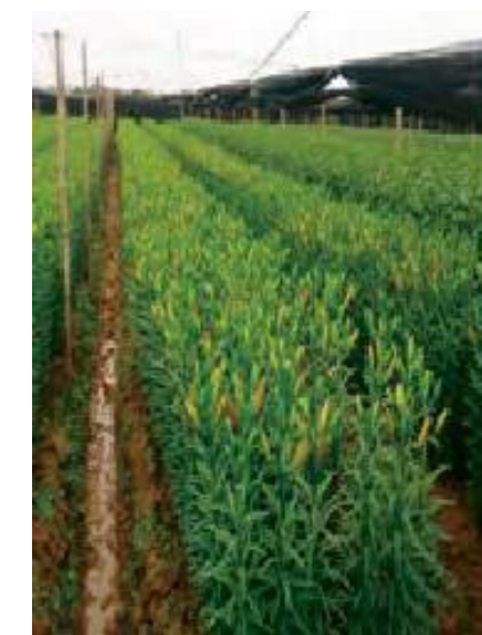
Salah satu tempat tanaman lily

Tuntasnya, program ini memberi impak yang positif kepada para pelajar Semester 6 kerana banyak ilmu koperasi dan budaya yang dipelajari sepanjang berada di Vietnam. Pelajar boleh mengenal pasti dan mempraktikkan strategi yang digunakan oleh gerakan koperasi di Vietnam bagi menambah baik nilai koperasi di Malaysia.