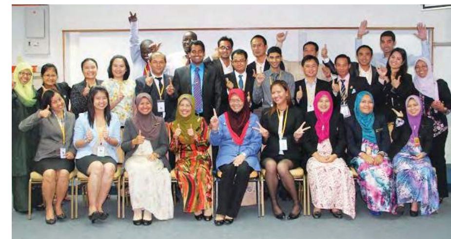
Wajah-wajah ceria para peserta dan penyelaras bersama Timbalan Ketua Pengarah (Akademik) (tengah, barisan hadapan) setelah program tamat