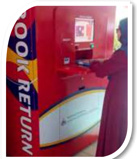
Proses pemulangan buku menggunakan bookdrop

Sistem RFID juga menjadi pilihan kerana memudahkan pencarian lokasi bahan seperti majalah, buku, tesis, kertas kerja dan banyak lagi. Penggunaan aplikasi ini secara interaktif membolehkan pengguna berhubung terus dengan sistem pengaturcaraan komputer. Pengaturcaraan komputer ini melibatkan komunikasi dua hala antara pengguna dan komputer. Segala maklumat berkaitan lokasi bahan akan diperolehi dengan lebih mudah dan cepat. Selain itu, sistem ini membantu pegawai perpustakaan mengawal pergerakan bahan di dalam perpustakaan. Sebagai contoh, sistem ini akan memberitahu lokasi sebenar kedudukan bahan sekiranya bahan tersebut berada di kedudukan yang salah.