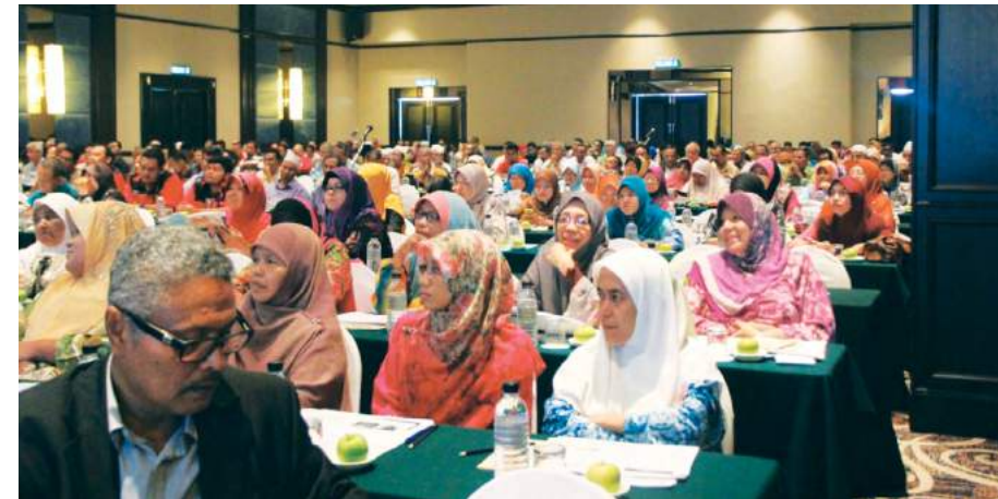
Antara peserta yang hadir