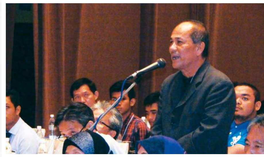
Sesi soal jawab

mendapatkan idea, cadangan dan maklum balas positif berkenaan industri tersebut dan diharapkan para koperator yang hadir dapat menggunakan peluang terhidang dengan sebaiknya untuk memastikan sektor koperasi negara terus membangun dalam menyahut seruan kerajaan. Hanya dengan pendekatan terkini dan sifat berani berubah ke arah kebaikan akan memastikan kelangsungan perniagaan koperasi.