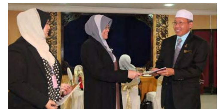
Ucapan penghargaan dan penyampaian sijil oleh Timbalan Ketua Pengarah Akademik MKM kepada peserta Program Induksi Pengurus PPK MADA Siri Ke-2