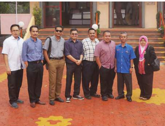
Lawatan ke Madhusagar Honey Cooperative, Mahabaleswar