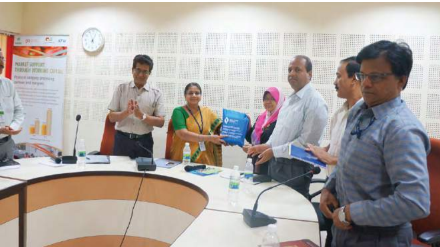
Penulis (empat dari kanan) menyerahkan cenderahati MKM kepada Pengarah Urusan National Bank for Agriculture and Rural Development Pune (NABARD)