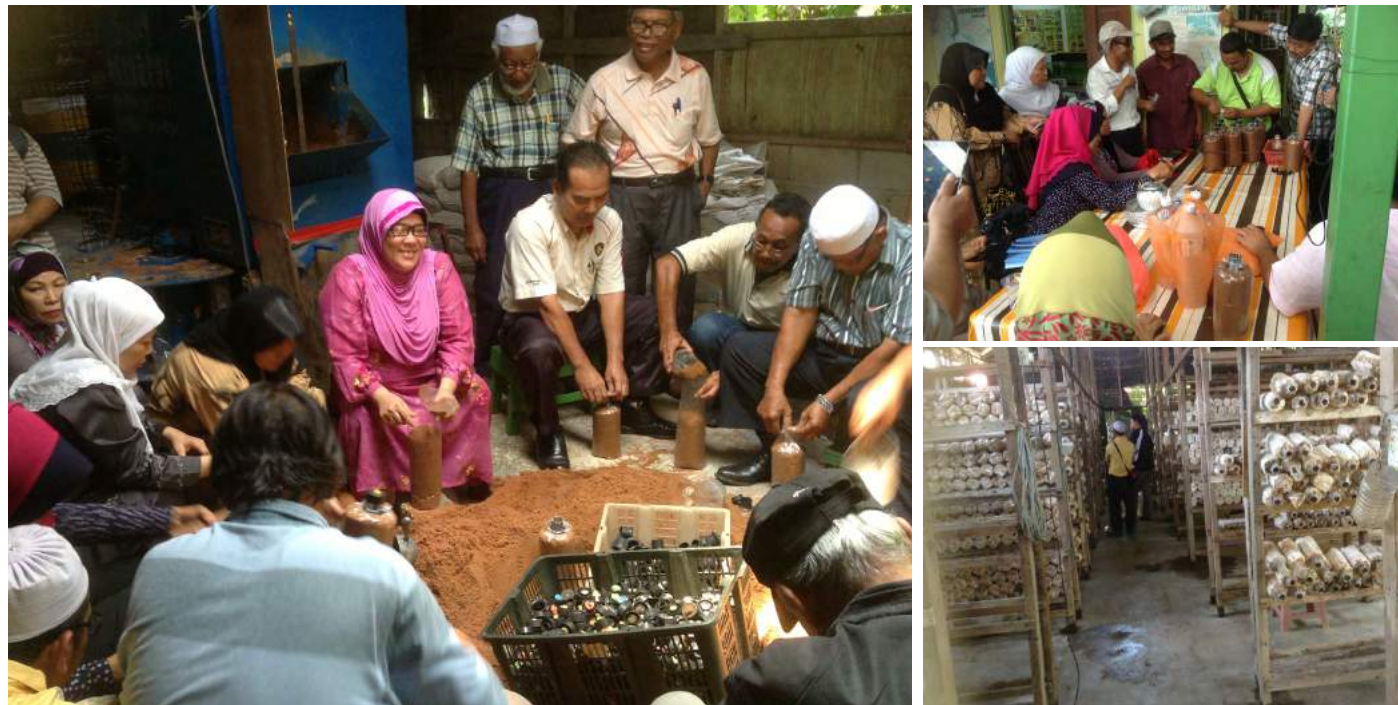
Sesi praktikal tanaman cendawan kepada peserta kursus

pengeluaran tanaman cendawan secara teori. Peserta juga diberi peluang untuk menghadiri sesi lawatan ke Mofamag Resources, Kg. Sri Aman, Puchong untuk melihat sendiri perusahaan tanaman cendawan dan mendengar taklimat lanjut daripada pengusaha tersebut. Peserta turut mempelajari kaedah membuat Rancangan Perniagaan Tanaman Cendawan selepas pulang daripada lawatan.