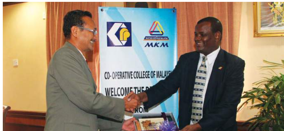
Penyampaian cenderahati kepada Ketua Pengarah Federal Cooperative Agency, Republik Ethiopia

operasi MKM sebagai antara 3 institusi latihan perkoperasian terbaik di Asia selain Korea dan Thailand yang