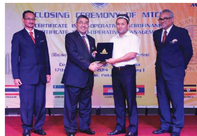
Timbalan Menteri Perdagangan Dalam Negeri, Koperasi dan Kepenggunaan menyampaikan sijil kepada peserta dari Uzbekistan

kepada gerakan koperasi secara global dalam aspek pengurusan dan pembiayaan mikro. Para peserta amat berpuas hati dengan perjalanan keseluruhan program. Pelan Tindakan telah dihasilkan oleh setiap peserta untuk dibentangkan kepada agensi atau