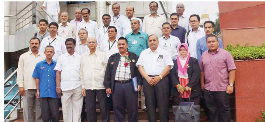
Bersama Pengerusi dan Pengurusan Atasan Satara District Central Cooperative Bank