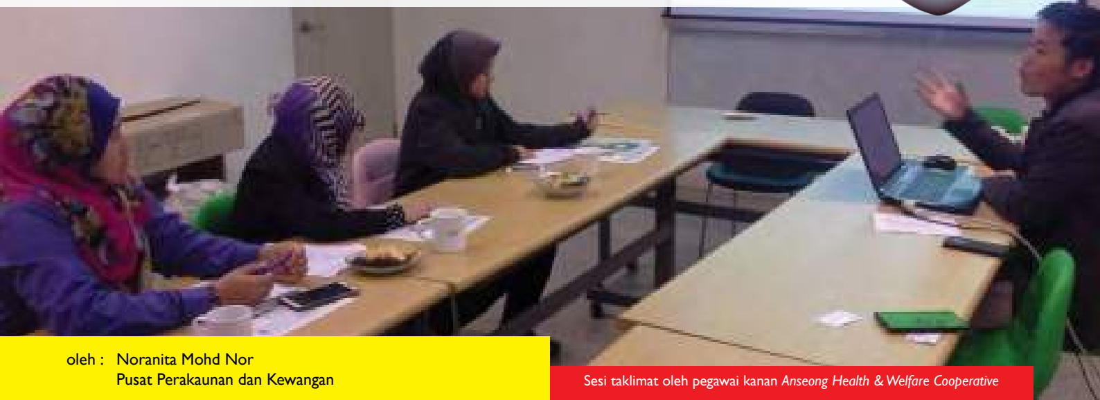
oleh : Noranita Mohd Nor Pusat Perakaunan dan Kewangan