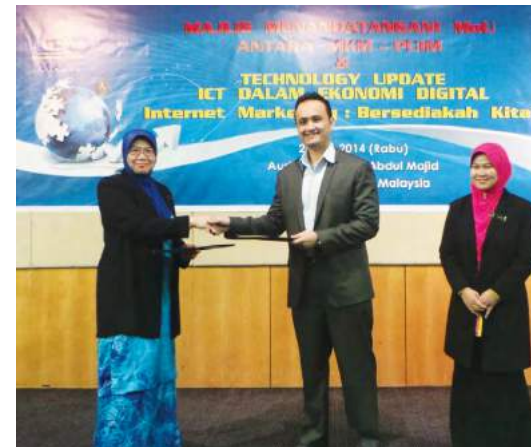
Penyerahan Memorandum Persefahaman (MoU) antara MKM dan PUIM