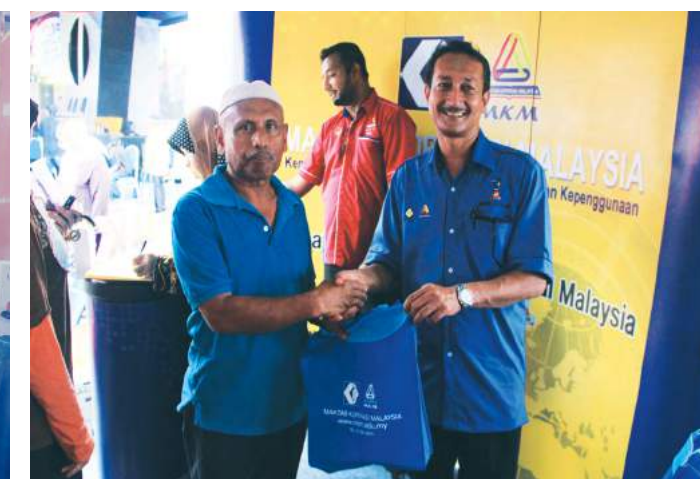
Ketua Pengarah MKM menyampaikan cenderahati kepada pengunjung di Hari Koperasi Negara 2014