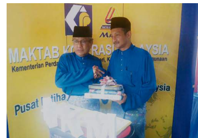
Menteri PDNKK menerima cenderahati daripada Ketua Pengarah MKM

Secara keseluruhannya, HKN kali ini memberi lebih banyak manfaat kepada masyarakat khususnya para koperator yang terlibat dalam membangunkan sektor koperasi di negara ini. Sambutan lebih 10 ribu pengunjung membuktikan sambutan masyarakat terhadap HKN.