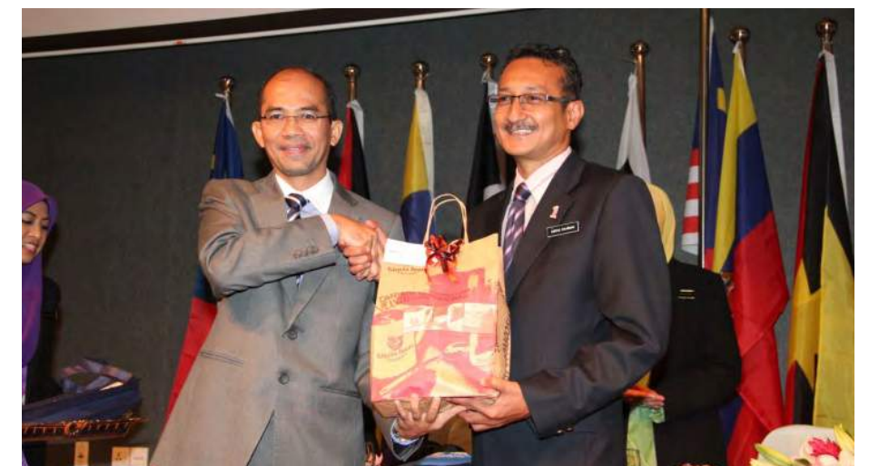
Ketua Pengarah MKM menerima cenderahati daripada Pengarah Urusan PNS

terlibat dalam pembangunan koperasi dan anggota koperasi. Turut hadir sama dalam program tersebut adalah wakil-wakil dari Suruhanjaya Koperasi Malaysia (SKM) dan ANGKASA.