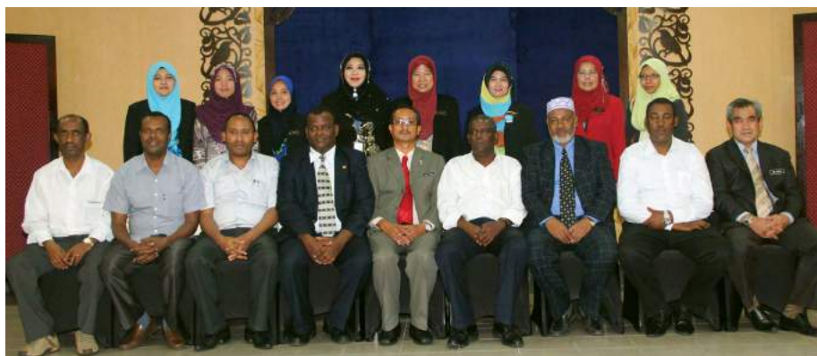
Ketua Pengarah MKM bergambar kenangan bersama delegasi dari Federal Cooperative Agency, Republik Ethiopia

Disimpulkan bahawa delegasi mengambil contoh struktur dan