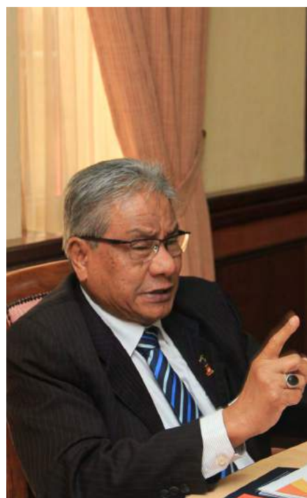
YB Dato' Seri Hasan bin Malek berharap transformasi MKM dapat membuka dimensi baharu yang lebih dinamik dan progresif