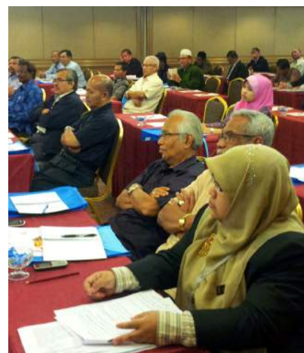
Sebahagian peserta yang turut hadir

Secara keseluruhan, program ini telah berjaya dilaksanakan dan mendapat maklum balas positif daripada para peserta. Mereka berpendapat bahawa program ini selain berjaya meningkatkan pengetahuan dalam aktiviti perumahan, ia juga amat bertepatan dalam memberikan pelbagai manfaat terutama kepada koperasi yang telah dan akan menceburi bidang perniagaan dalam industri perumahan.