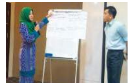
Para peserta diberi peluang berbincang dan membentangkan idea mereka bagi memperkasakan hala tuju koperasi masing-masing