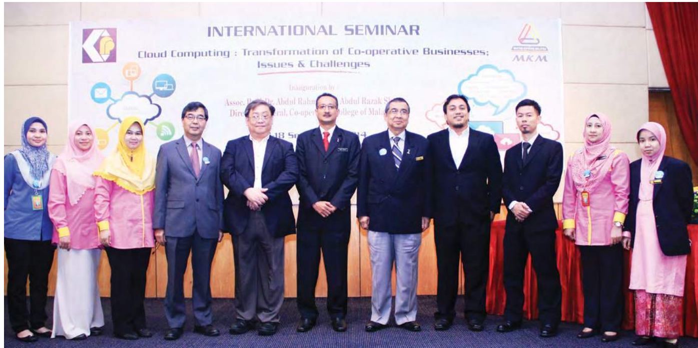
Barisan urus setia bergambar kenangan bersama para pembentangan sesi 1 dan Ketua Pengarah MKM

Topik yang dibentangkan semasa seminar ini ialah: