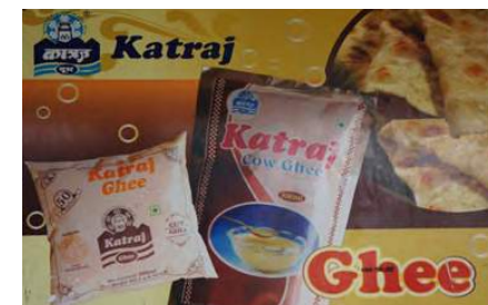
■ Salah satu produk keluaran Katraj Dairy Pune Co-operative (KDPC)

Kami juga telah dibawa melawat Pune District Central Cooperative Bank Ltd (PDCC) dan National Bank for Agriculture and Rural Development (NABARD) yang terletak di Pune. NABARD berperanan sebagai fasilitator untuk sektor perbankan dalam bidang pertanian dan pembangunan luar