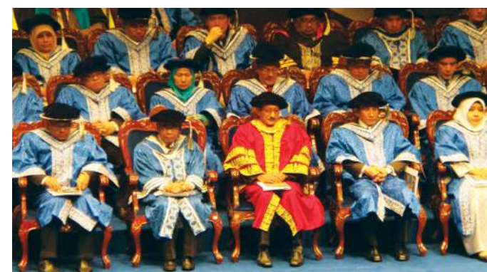
Ketua Pengarah Maktab Koperasi Malaysia (tiga dari kanan) di pentas utama Majlis Konvokesyen UUM ke-27