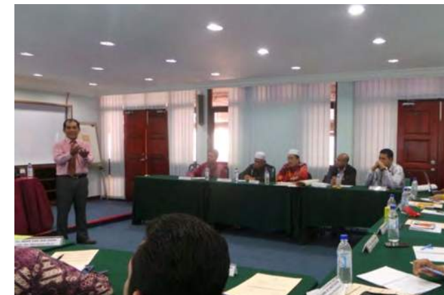
Pengurus PPK disarankan untuk tampil sebagai pemimpin yang bertransformasi bagi menjayakan matlamat PPK

pengurus PPK MADA lulus dengan baik dalam peperiksaan yang diadakan pada penghujung program ini. Beberapa siri latihan susulan sedang dalam perbincangan antara pihak MKM dengan MADA. Diharapkan kerjasama ini berterusan dan dapat memberi impak yang positif kepada kedua-dua pihak. MKM yang mahu mencapai kejayaan sebagai sebuah institusi latihan yang cemerlang berhasrat memanjangkan program sebegini kepada agensi-agensi dan pertubuhan-pertubuhan lain agar kelebihan pengendalian latihan MKM ini dapat dimanfaatkan lebih banyak pihak lagi di masa akan datang.