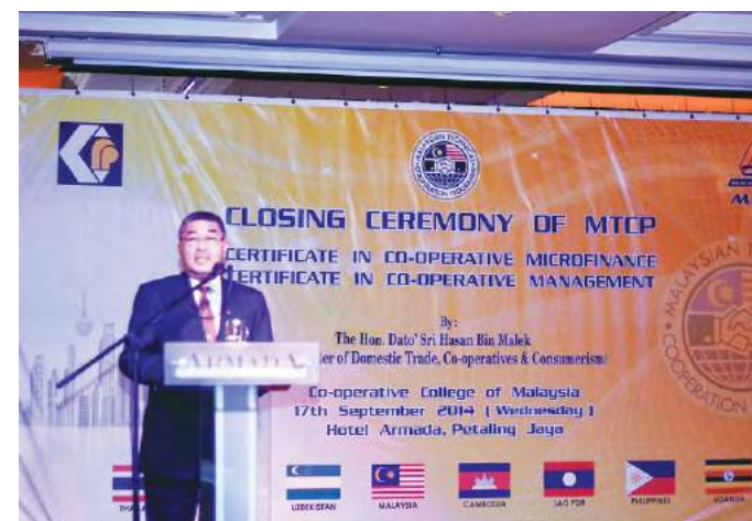
YB Senator Dato' Seri Ahmad Bashah bin Md. Hanipah, Timbalan Menteri Perdagangan Dalam Negeri, Koperasi dan Kepenggunaan merasmikan Majlis Penutupan Program MTCP 2014

Modul program yang dijalankan pada kali ini lebih menjurus kepada penyelesaian alternatif terhadap isu-isu dan cabaran yang memberi kesan