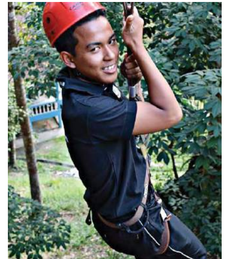
Aktiviti flying fox

Pada hari ketiga Minggu Orientasi pelajar DPK 2014, para pelajar telah dibawa ke Kem Nur Lembah Pangsun di Hulu Langat, Selangor. Perjalanan yang mengambil masa lebih kurang 1 jam 30 minit itu dilakukan bagi mendedahkan mereka dengan pengalaman berada