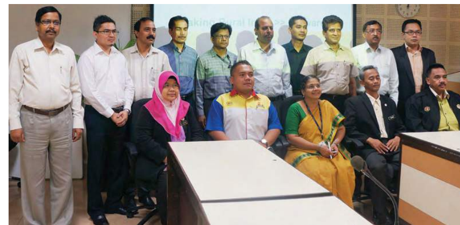
■ Gambar kenangan bersama pihak Pengurusan Atasan (NABARD)

Peserta juga berpeluang melawat Pejabat Pendaftar Koperasi Maharashtra, Pune dan melawat Satara District Central Cooperative Bank (SDCC) di daerah Satara. Semasa di SDCC kami dibawa melihat Self Help Group (SHG) di bandar Satara. SHG tersebut merupakan gabungan 22 buah SHG yang kecil terdiri daripada 440 orang ahli. SHG tersebut ditubuhkan pada tahun 2003 dan menjalankan perniagaan kedai runcit, pinjam meminjam kepada anggota dan kedai emas. Pada tahun 2013, SHG tersebut memperoleh pendapatan tahunan sebanyak 150 lakhs (lingkungan RM825 ribu). Self Help Group (SHG) merupakan salah satu strategi yang diadakan oleh pemerintah di India melalui aktiviti Koperasi Perbankan dan Kredit. Kerajaan India telah memperkenalkan konsep Self Help Group untuk menolong rakyat yang miskin terutama bagi suri rumah yang tidak mempunyai pendapatan tetap.