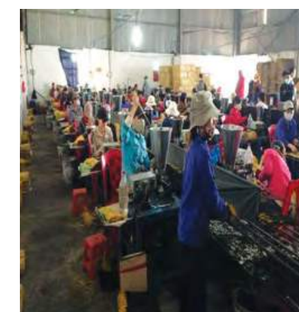
Pekerja koperasi Phu Hai Cooperative (scent burning production) yang sedang melakukan proses-proses menghasilkan colok.