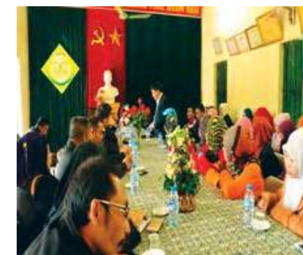
Pelajar BBA, pegawai latihan MKM dan Pegawai Angkasa melawat koperasi HTX Nong Nghiep Xa Dan Phuong (Agricultural Coop)