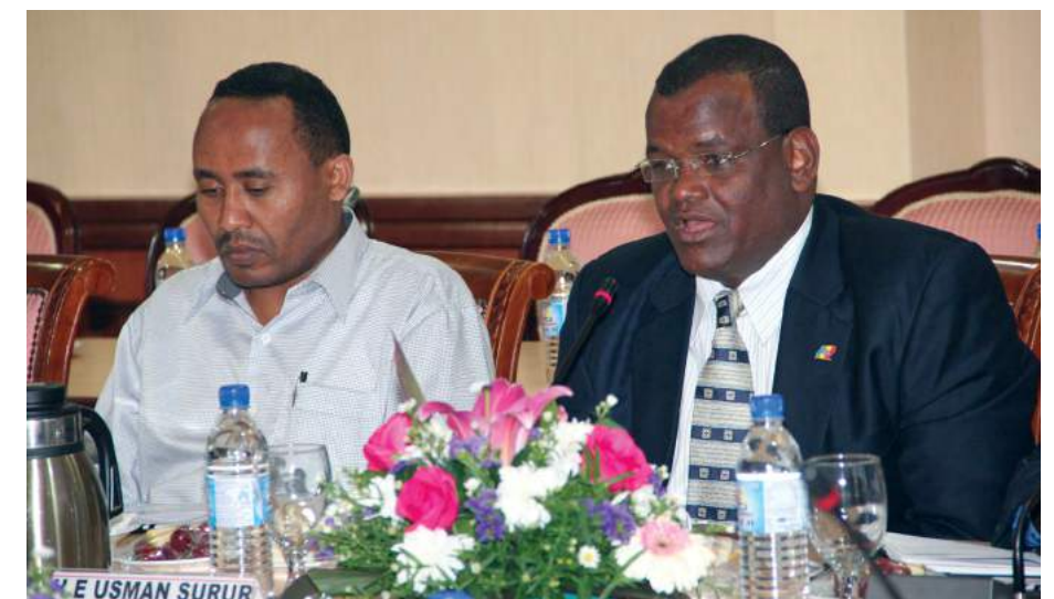
H.E Usman Surur, Ketua Pengarah, Federal Cooperative Agency , Republik Ethiopia (Kanan)

Antara lainnya delegasi juga ingin mengetahui tentang sumber kewangan operasi MKM dan kaitan MKM dengan kerajaan. Selain itu, mengetahui cara koperasi-koperasi di Malaysia dikategorikan, bentuk bantuan kewangan yang disalurkan oleh kerajaan kepada koperasi dan kelebihan koperasi dalam aspek percukaian turut dibincangkan. Malah isu-isu berkaitan tadbir urus yang ditekankan dalam