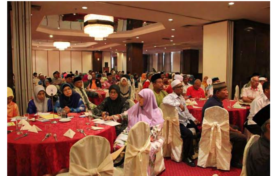
Sebahagian peserta yang hadir

Secara keseluruhannya, program ini telah membuka minda para koperator dan hadirin yang hadir berkenaan tanggungjawab manusia sebagai