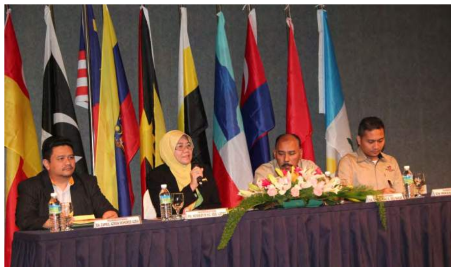
Panel pembentang bersama moderator

Dalam era globalisasi ini gerakan koperasi seharusnya merancang pelan transformasi ke arah perniagaan yang lebih berdaya saing seiring dengan lain-lain perniagaan yang wujud.