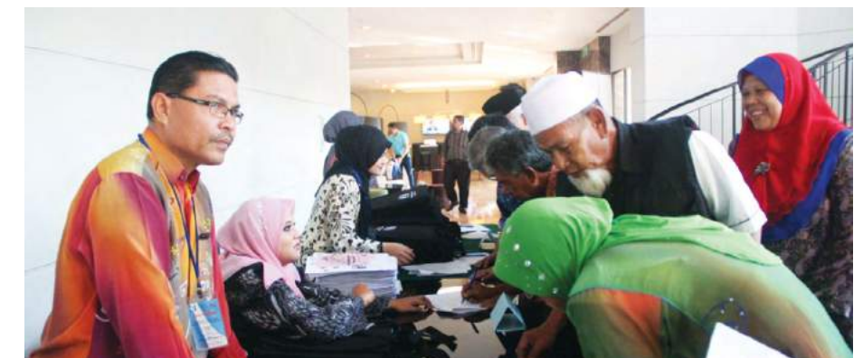
Sekitar pendaftaran Bicara Profesional "Usahawan Penternakan: Peluang Perniagaan Koperasi"