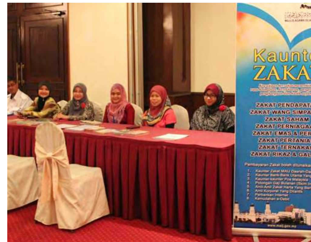
Kaunter zakat yang dibuka bagi mendapatkan penerangan berkenaan zakat