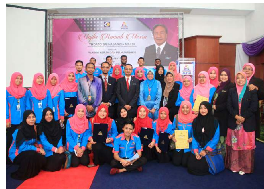
Bergambar bersama penerima Biasiswa Pendidikan MKM

Akhir sekali YB Menteri KPDNKK menerusi ucaptamanya berharap dengan adanya transformasi MKM, bakal membuka dimensi baru kepada organisasi ini agar lebih dinamik dan progresif serta dapat membantu usaha KPDNKK untuk mencapai sasaran Dasar Koperasi Negara khususnya.