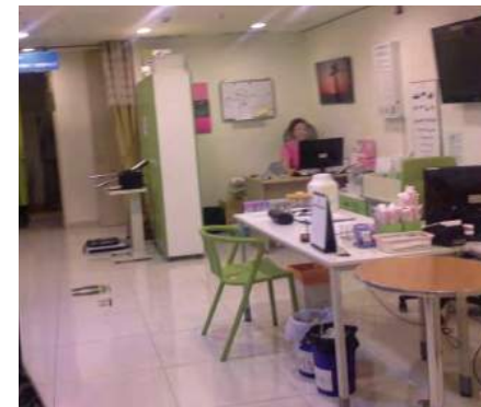
Suasana salah satu klinik kesihatan koperasi

Program kepakaran ini memberi banyak maklumat dan meningkatkan ilmu pengetahuan pegawai latihan MKM mengenai budaya masyarakat Korea yang sangat mementingkan penjagaan kesihatan. Pendekatan aktiviti-aktiviti pendidikan kesihatan yang dilaksanakan secara agresif oleh koperasi kesihatan di Korea ternyata memberi kesedaran bahawa kesihatan sangat penting dalam kehidupan ibarat kata pepatah, “mencegah adalah lebih baik daripada merawat”.