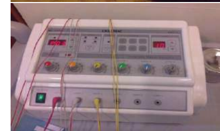
Peralatan-peralatan yang terdapat di klinik