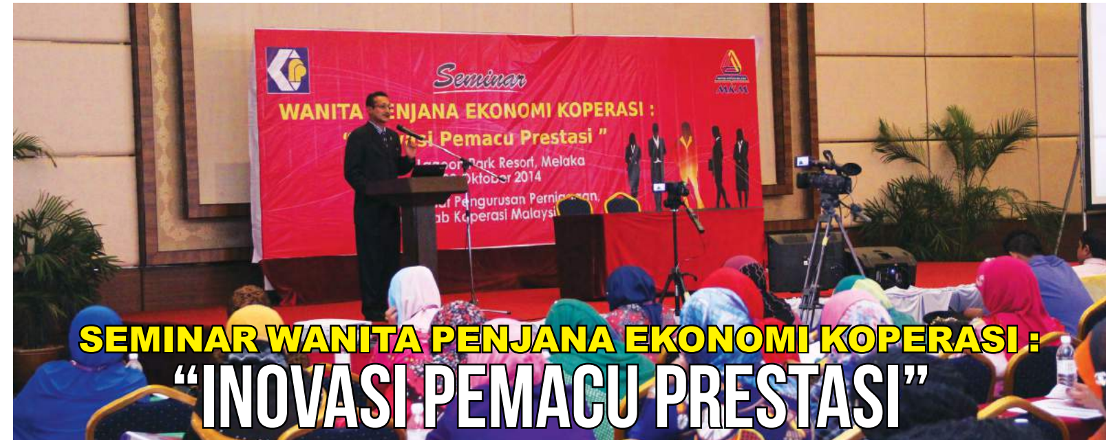
oleh : Khairun Niza Mohd Anuar Pusat Pengurusan Perniagaan

semakin pesat berkembang, walaupun masih baru di Malaysia dan semestinya ia mempunyai nilai yang besar dalam operasi perniagaan jika koperasi dapat memanfaatkannya. Tidak mustahil bagi koperasi khususnya untuk beralih daripada in-house computing kepada cloud computing dengan mengambil kira semua aspek yang dibincangkan dalam seminar ini.