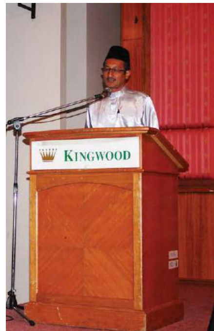
Ketua Pengarah MKM

Objektif utama program Bicara Profesional ini adalah untuk memberi pendedahan peluang dan potensi perniagaan 'online' kepada para koperator. Selain itu koperator turut didedahkan secara teknikal kaedah pemasaran 'online' menggunakan medium 'facebook'. Dalam masa yang sama, program tersebut juga diharap