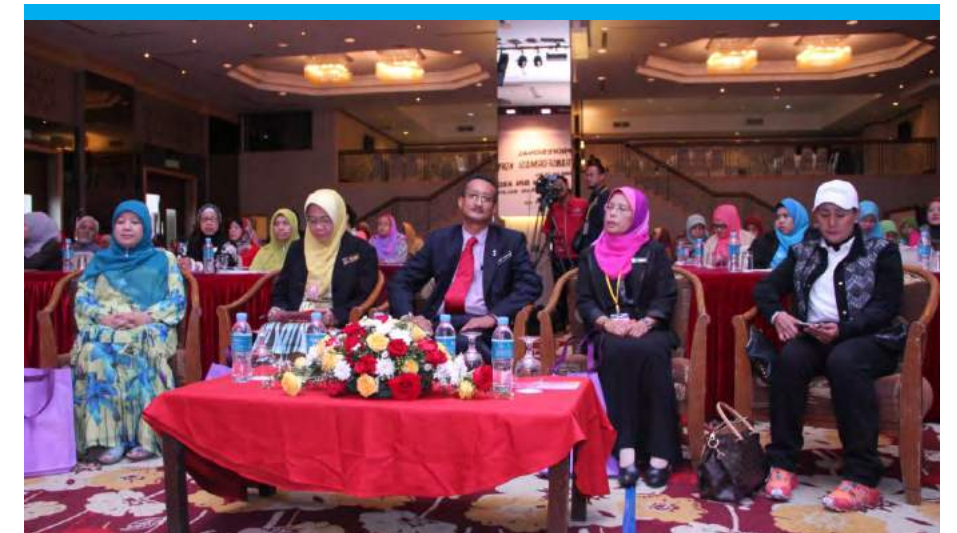
Tetamu VIP yang turut hadir

Sejajar dengan itu, pada 25 September 2014, telah berlangsung program Bicara Profesional bertemakan “Wanita Pemacu Transformasi Koperasi” anjuran Pusat Tadbir Urus dan Perundangan Koperasi, Maktab