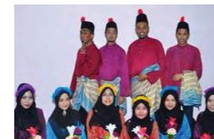
Para pelajar BBA MKM-UUM membuat persembahan Tarian Zapin sempena Hari Guru di NETC