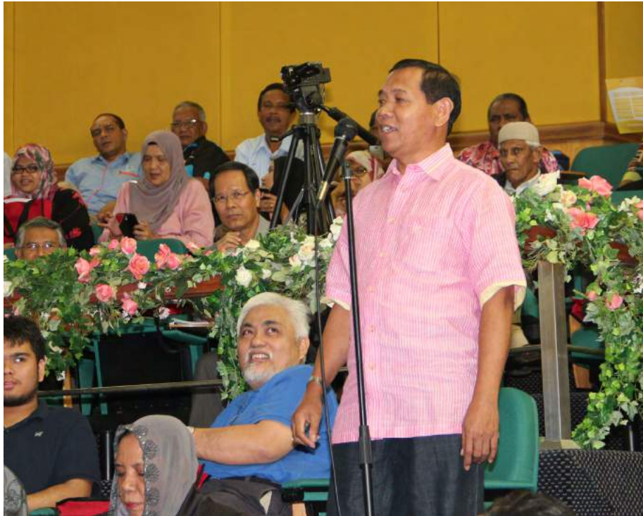
Peserta mengajukan soalan