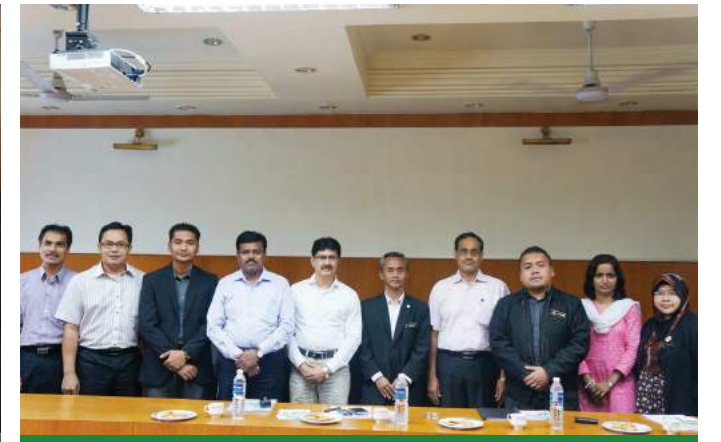
■ Bersama pihak pengurusan Pendaftar Koperasi Maharashtra, Pune