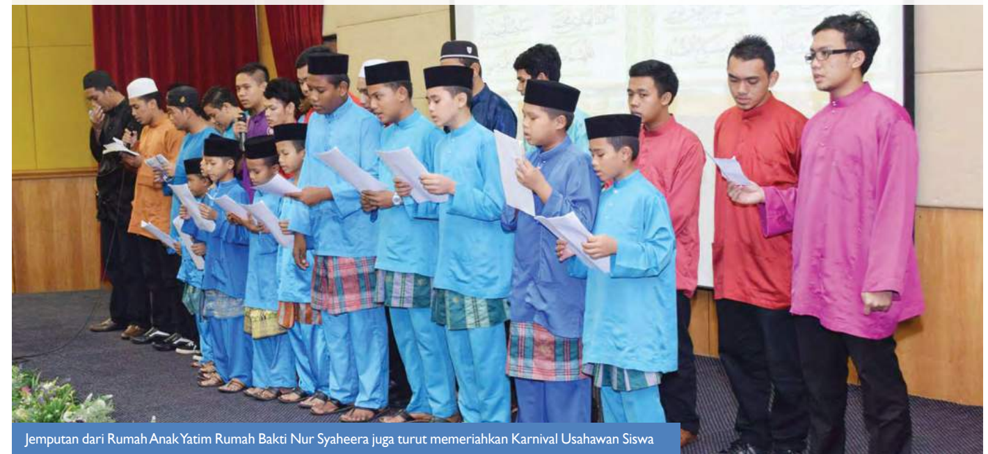
Jemputan dari Rumah Anak Yatim Rumah Bakti Nur Syaheera juga turut memeriahkan Karnival Usahawan Siswa

Oleh : Nur Salsabila Othman Pelajar, Pusat Pendidikan Tinggi