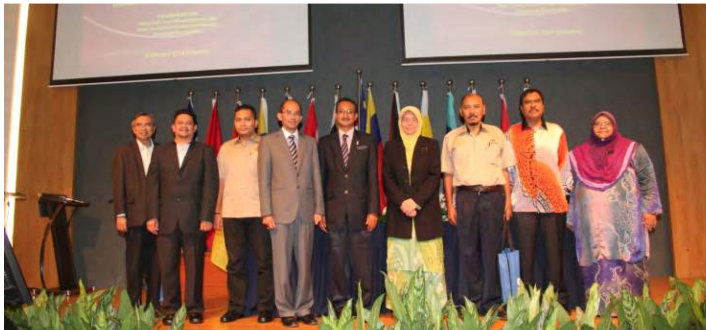
Tetamu VIP yang hadir

para peserta sepanjang sesi soal jawab berlangsung. Di samping penglibatan aktif para peserta, pembentangan yang berkesan telah berjaya memberikan impak yang positif kepada semua peserta yang hadir dalam usaha menggalakkan koperasi menceburi perniagaan sistem francais.