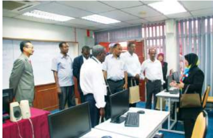
Lawatan ke Makmal Komputer