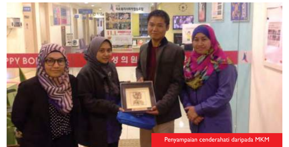
Penyampaian cenderahati daripada MKM