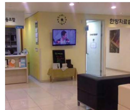
Ruangan menunggu di klinik kesihatan koperasi