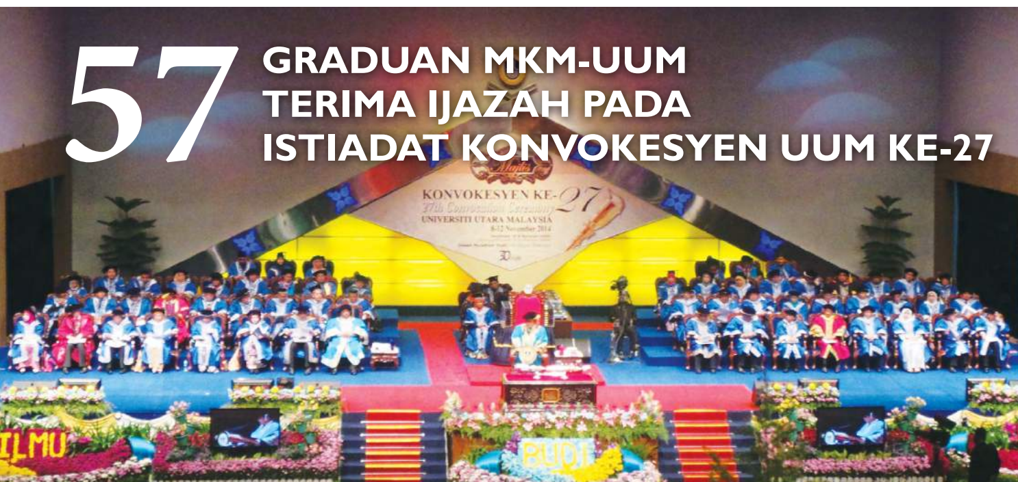
oleh : Cik Nazirah Baharudin Pusat Pendidikan Tinggi

Istiadat konvokesyen Universiti Utara Malaysia ke-27 telah berlangsung selama lima hari berturut-turut mulai 8 hingga 12 November di Dewan Mu'adzam Shah UUM Sintok. Pada hari Rabu bersamaan 12 November 2014, seramai 57 graduan program Ijazah Sarjana Muda Pentadbiran Perniagaan (BBA) pengkhususan Pengurusan Koperasi MKM-UUM telah menerima ijazah masing-masing. Program ijazah ini merupakan program kerjasama antara Maktab Koperasi Malaysia (MKM) dan Universiti Utara Malaysia (UUM). Program ini mula diperkenalkan pada Disember 2008 dengan 32 graduan pertama telah bergraduat pada 2012. Pada masa ini terdapat seramai 87 orang pelajar sedang mengikuti