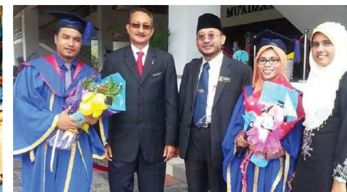
Ketua Pengarah MKM (dua dari kiri) bersama dengan graduan MKM-UUM selepas Majlis Konvokesyen UUM ke-27

"Ini terbukti dengan kejayaan program ini yang memenuhi kehendak pasaran masa kini dan sebagai contoh, sebanyak 67 peratus graduan MKM-UUM yang membina kerjaya di koperasi yang ternama, di syarikat-syarikat serta menjadi tenaga pengajar dalam bidang koperasi.