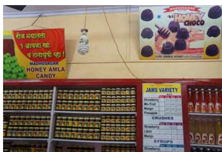
Pelbagai produk keluaran koperasi yang dihasilkan daripada madu

Selain itu, kami juga dimaklumkan bahawa 'The Satara DCCB' telah memenangi enam anugerah berturut-turut daripada Bank Pembangunan Pertanian dan Luar Bandar India kerana prestasi mereka.