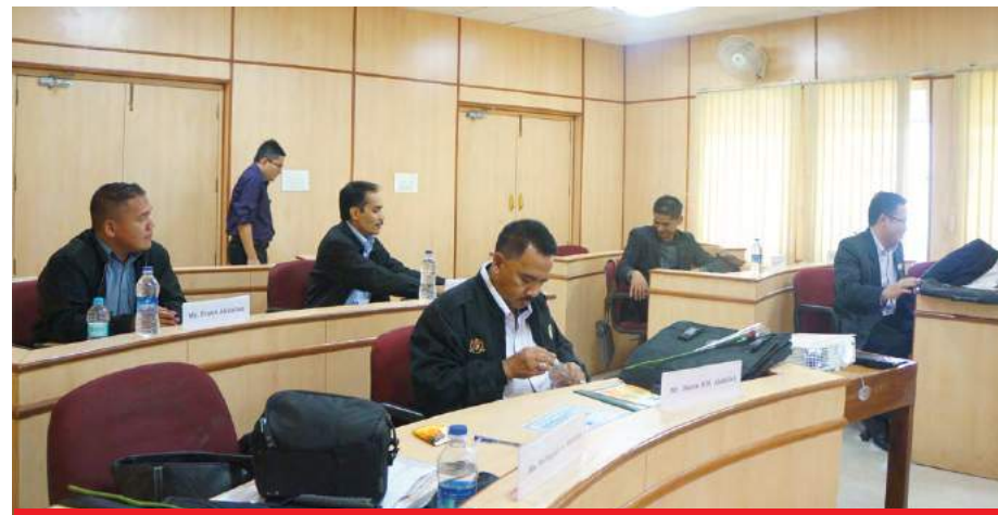
■ Suasana dalam bilik kuliah di VAMNICOM

Objektif program ini adalah untuk memberi pendedahan dan kefahaman mengenai perjalanan pengurusan Koperasi Bank dan Kredit di India. Program telah dijalankan selama 14 hari bermula dari 26 Mei sehingga 8