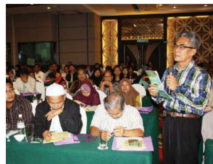
Sesi soal jawab bersama koperator