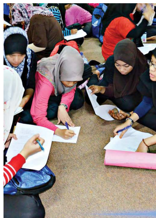
Aktiviti latihan dalam kumpulan (LDK)

Secara kesimpulannya, minggu orientasi ini diharap dapat mendedahkan para pelajar dengan dunia pembelajaran di institusi pendidikan khususnya dan MKM amnya. Para pelajar diharap dapat memanfaatkan pendedahan awal yang diberikan oleh Pusat Pendidikan Tinggi dalam menyampaikan maklumat-maklumat penting kepada para pelajar baru. Diharap para pelajar baru dapat menjadi seorang pelajar yang cemerlang sehingga mereka menamatkan pembelajaran Diploma Pengurusan Koperasi dan seterusnya mengharumkan nama baik MKM.