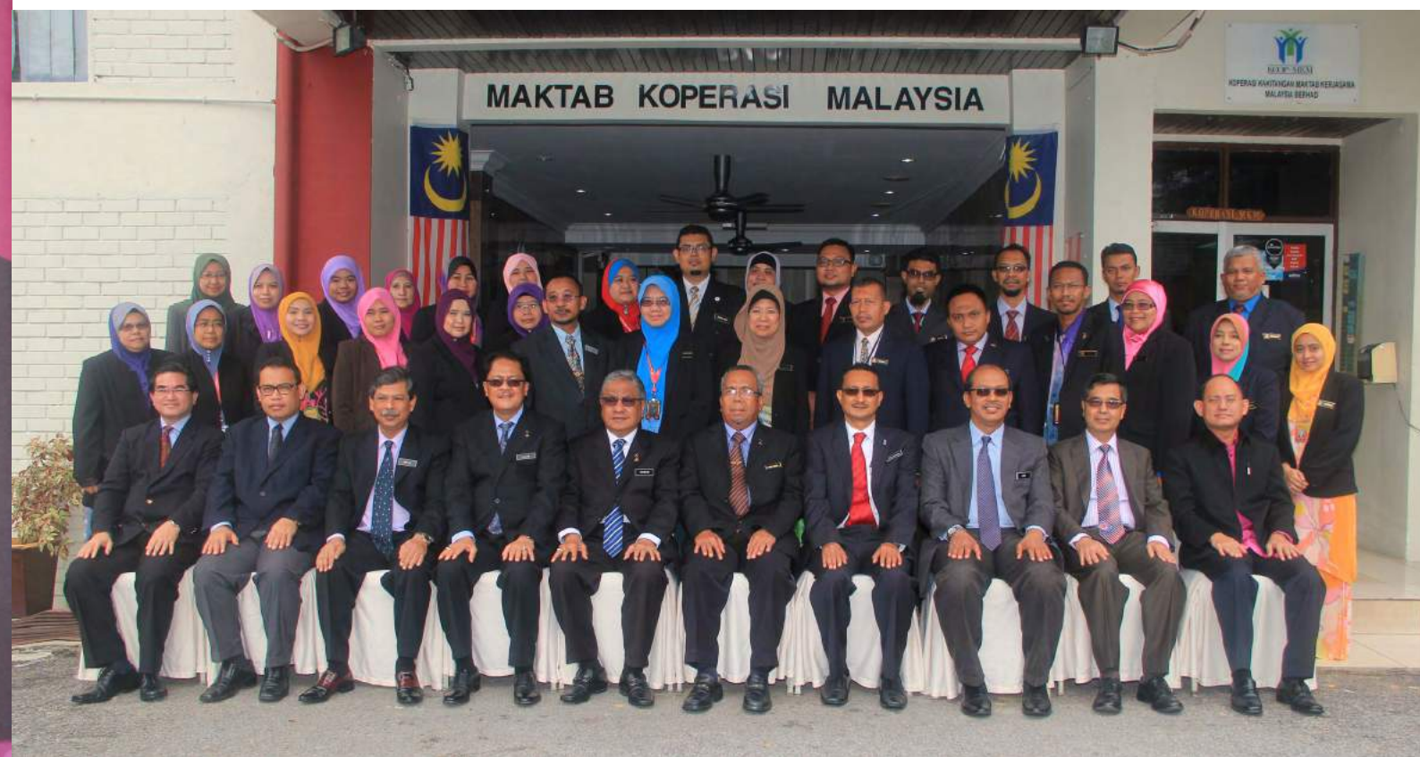
Bergambar kenangan bersama YB Menteri PDNKK

Berempat di Kampus Induk Maktab Koperasi Malaysia (MKM) Petaling Jaya, Menteri Perdagangan Dalam Negeri, Koperasi dan Kepenggunaan (PDNKK), YB Dato' Seri Hasan bin Malek telah menghadiri Majlis Taklimat Transformasi MKM dan Ramah Mesra YB Menteri bersama Staf dan Pelajar MKM. Majlis yang diselenggarakan oleh pihak MKM ini telah berlangsung pada 22 Januari 2015. Seramai 300 orang termasuk tetamu jemputan, pihak media, kakitangan dan pelajar MKM turut hadir memeriahkan majlis ini.