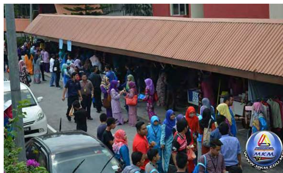
Antara gerai jualan yang dibuka