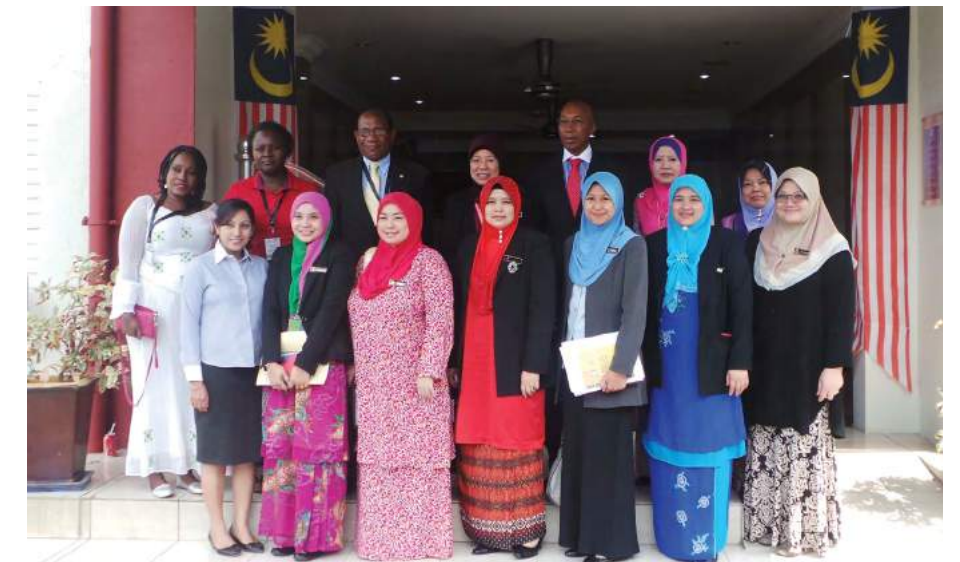
Delegasi KIM bergambar kenangan dengan pegawai-pegawai MKM

kesungguhan mereka untuk mengetahui lebih dekat tentang perkembangan gerakan koperasi di Malaysia. Delegasi ini berpendapat jalinan kerjasama antara Maktab Koperasi Malaysia (MKM) dengan Kenya Institute Management (KIM) merupakan tapak permulaan untuk bertukar-tukar pendapat dan mengambil kira pendekatan MKM sebagai institusi yang telah lama mendalami ilmu pengetahuan dalam pendidikan koperasi.