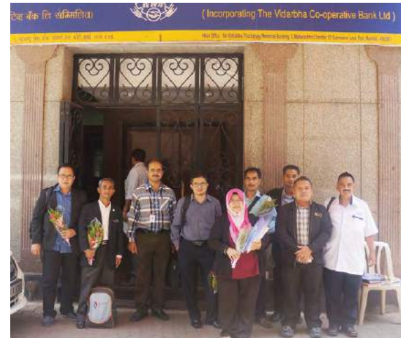
Lawatan ke Maharashtra State Cooperative Bank Ltd., Mumbai