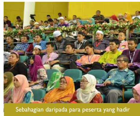
Sebahagian daripada para peserta yang hadir