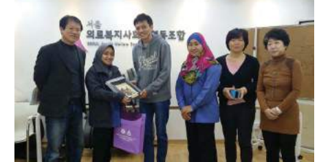
Sesi taklimat dan lawatan di Seoul Health & Welfare Cooperative