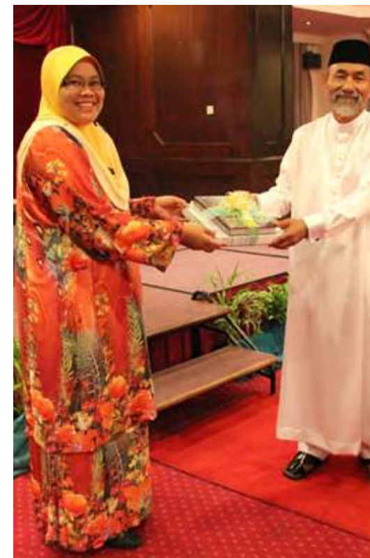
Penyampaian cenderahati kepada penceramah jemputan