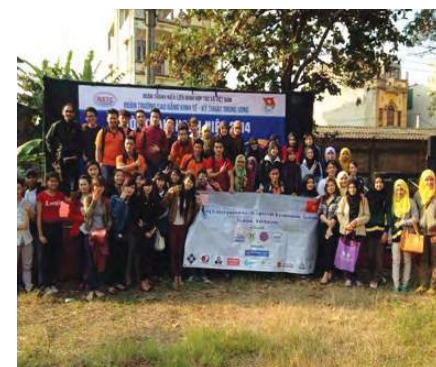
Pelajar BBA Semester 6 bersama dengan Pelajar NTEC menjayakan program Fire Camp sempena "Teacher's Day"

Para pelajar telah dibawa ke NETC, Hanoi, Vietnam sebagai aktiviti pertama