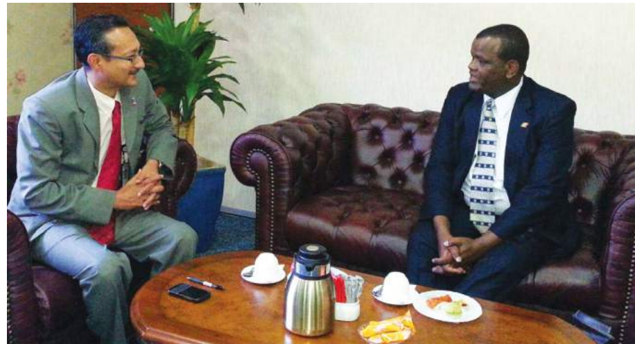
Ketua Pengarah MKM beramah mesra dengan Ketua Pengarah Federal Cooperative Agency, Republik Ethiopia